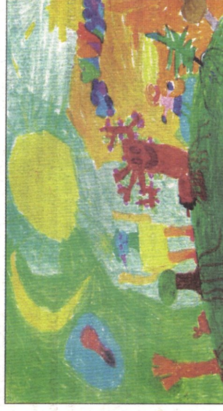
Ser HİBARDİYAN (8)