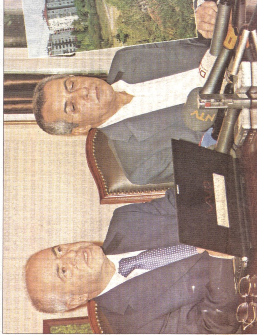
Maliye Bakanlığı'nın sahibi olduğu, imar iznini Büyükdşehir Belediyesi'nin verdiği Meteoroloji İstasyonu toplam arazisi 44 bin 738 metrekare büyüklüğünde....