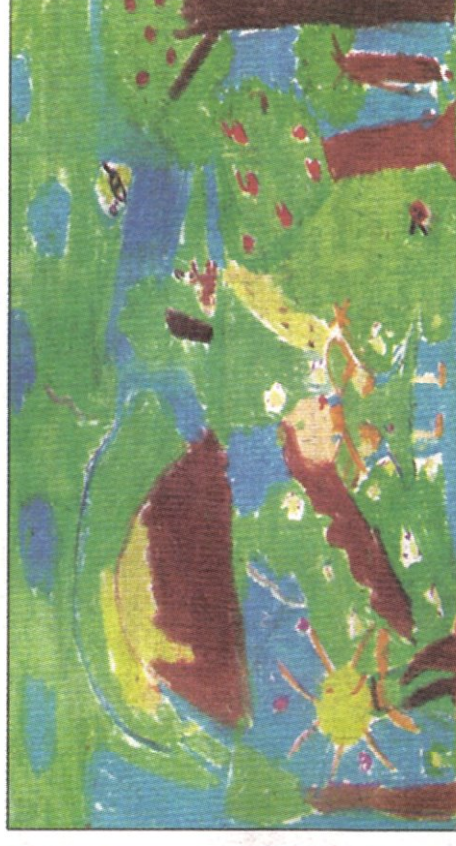
Selin TUNÇALI (7)